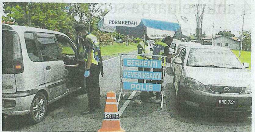
Anggota Polis Diraja Malaysia bersama anggota Jabatan Sukarelawan Rakyat (RELA) memperingatkan pemeriksaan terhadap pengguna jalan raya di Jalan Tanah Merah-Pendang, Kedah, semalam.

dan kita bakal melaksanakan tindakan sewajarnya, sama ada se-kadar nasihat atau menutup premis berkenaan.