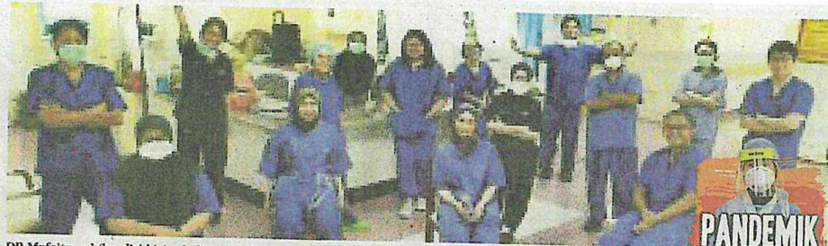
DR Mafeitzeral (berdiri kiri sekali) sukarelawan barisan hadapan bersama rakan setugasnya di Hospital Sungai Buloh, Selangor.